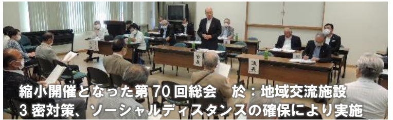
令和2年度 役員一覧表