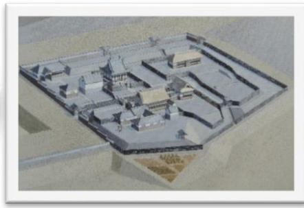
成徳書院想像復元図 令和元年10月