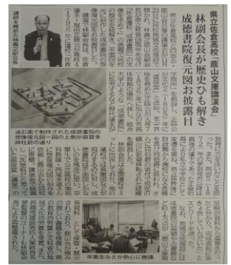
『佐倉よみうり』で紹介